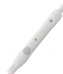
採血用穿刺器具 ナチュレットplusデバイス