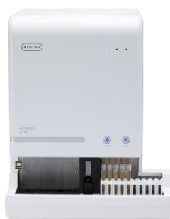
尿沈渣検査の 心強いパートナーとして